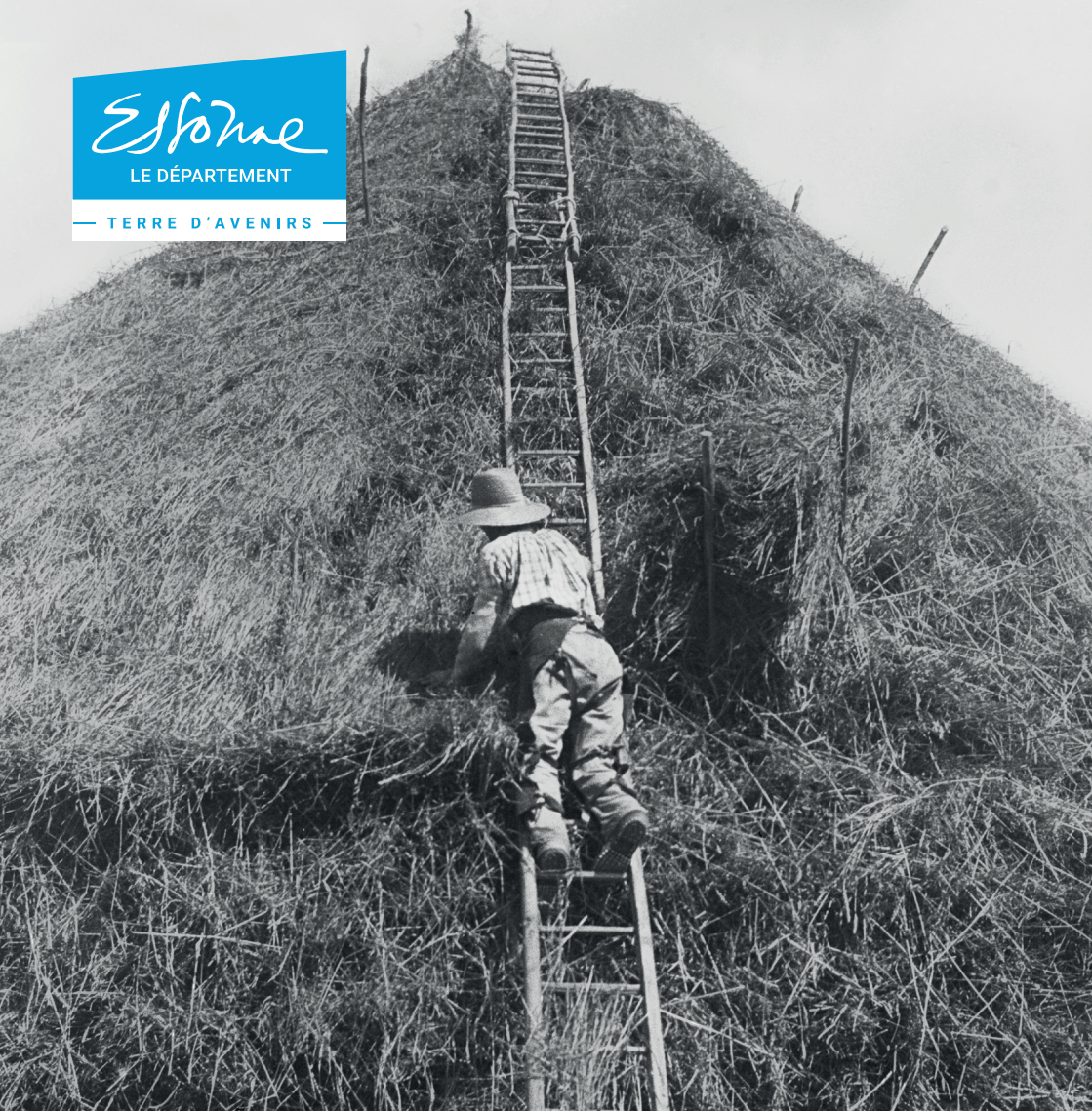
Table ronde sur la photographie